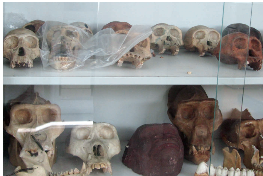
Die Universität Tübingen unterhält eine Sammlung von Affenschädeln und Rekonstruktionen, an denen Studenten die Evolution von Primaten nachvollziehen können.