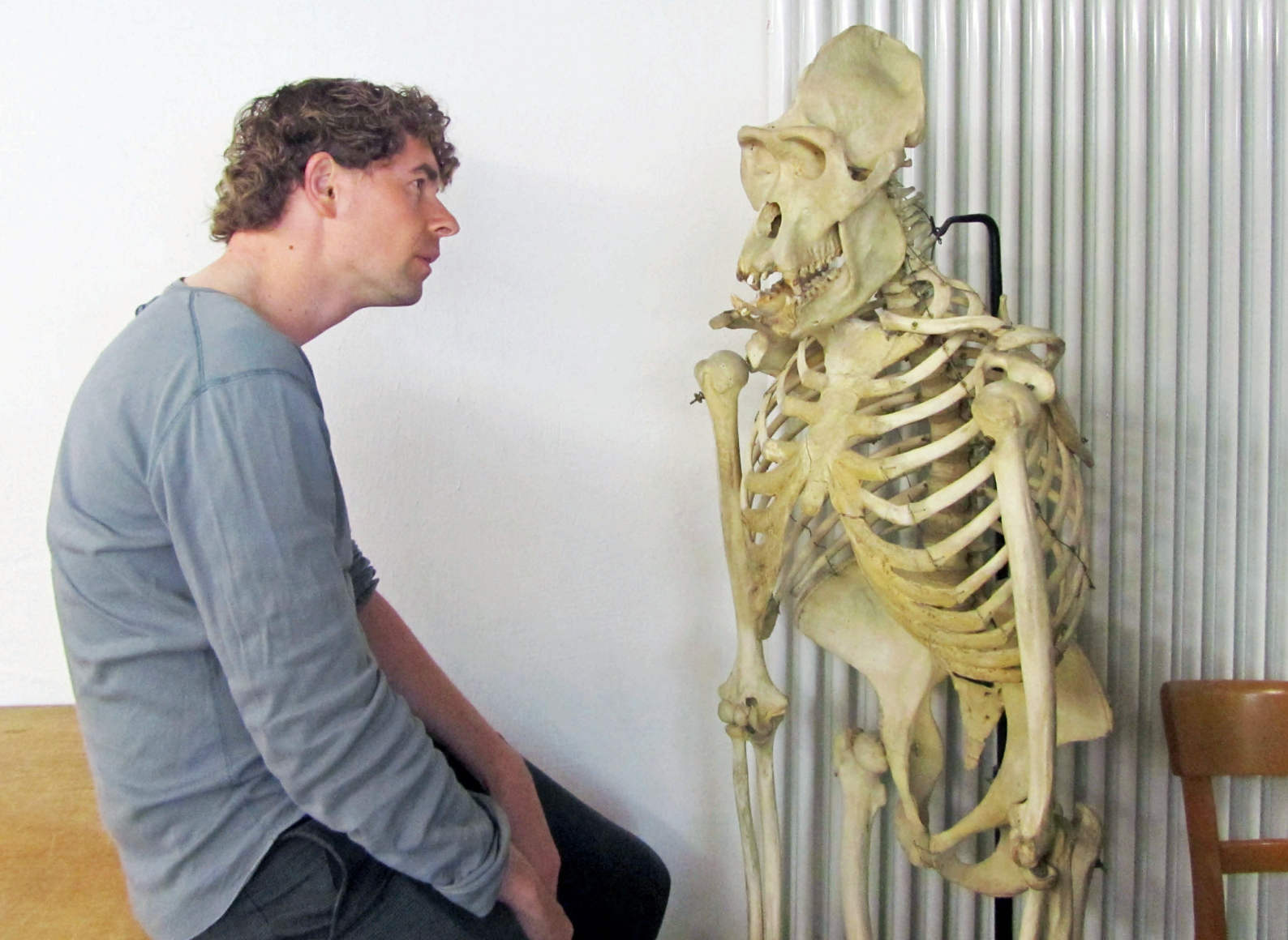
Zwiesprache mit einem nahen Verwandten. Das Skelett eines Menschenaffen hat im Keller der Tübinger Universität bereits Generationen von Studenten gesehen, während die mittelalterlichen Menschenschädel, nach Fundort inventarisiert, in Pappschachteln gelagert werden.

nen linken Ansichten sicher weit extremer. So habe ich erfahren: Der reale Sozialismus und der Faktor Mensch – das passt einfach nicht zusammen.“